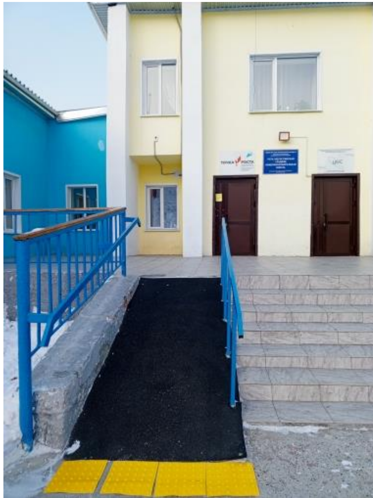
Фото-приложение наличия пандуса